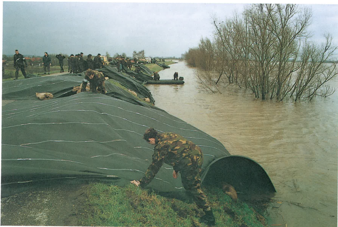
Arbeiten zur Deichsicherung in Ochtum/Niederlande 1995