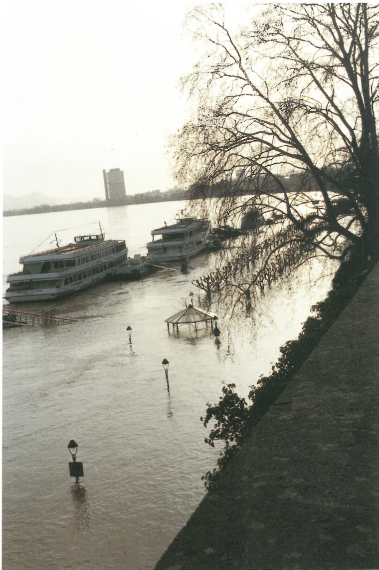
Hochwasser 1995, Bonn