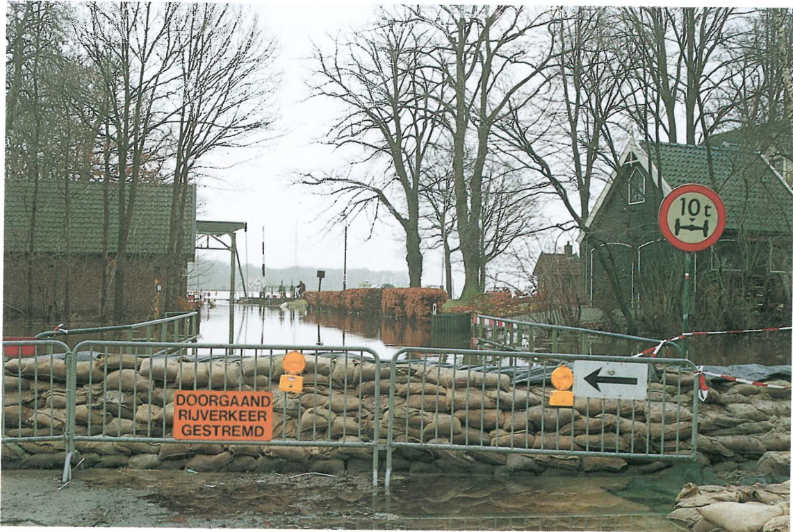
Hochwasserschutzmaßnahmen vor Ort in den Niederlanden