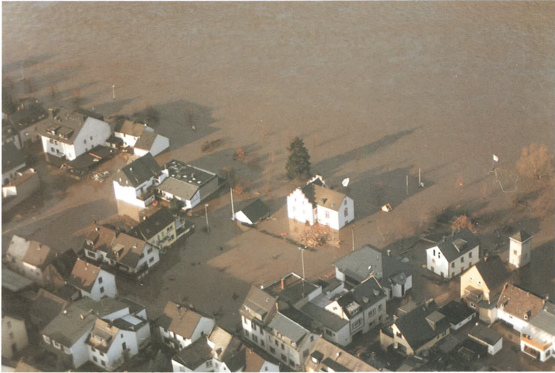
Hochwasser 1993/1994 - Koblenz, Vorort Lay/Mosel