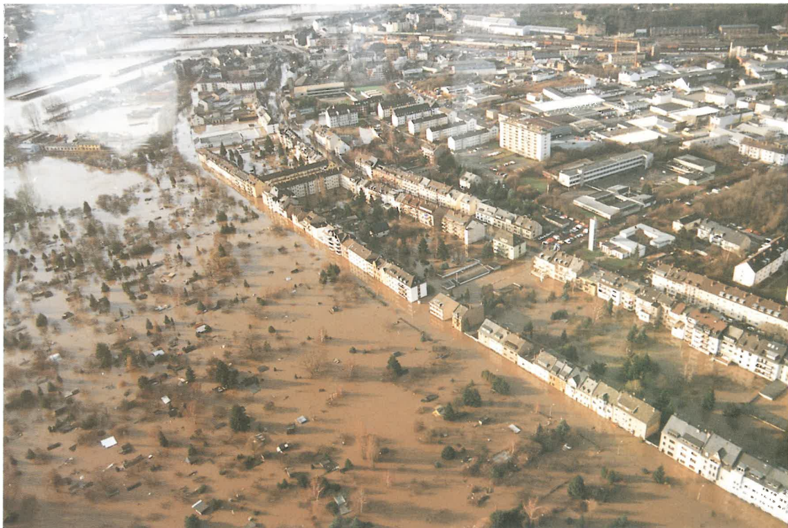
Hochwasser 1993/1994, Koblenz, Vorort Neuendorf/Rhein