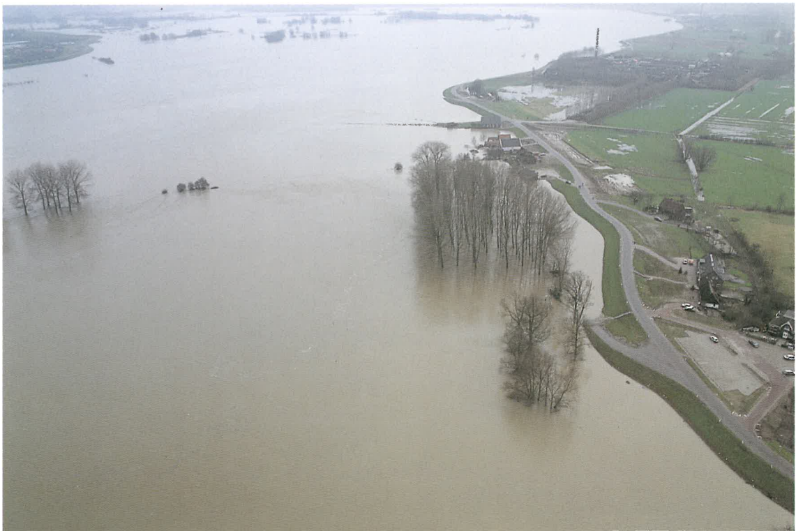
Rheinhochwasser 1993 in den Niederlanden