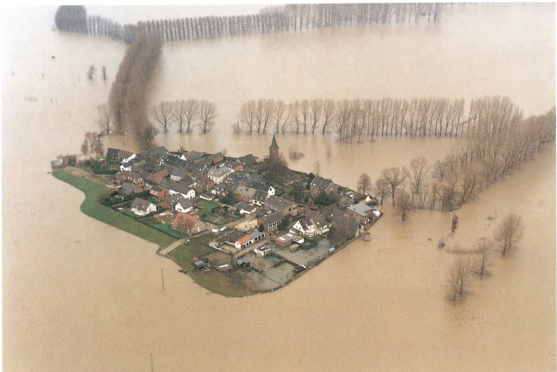
Hochwasser 1995 im Kreis Kleve, Niederrhein, Ort Schenkenschanz