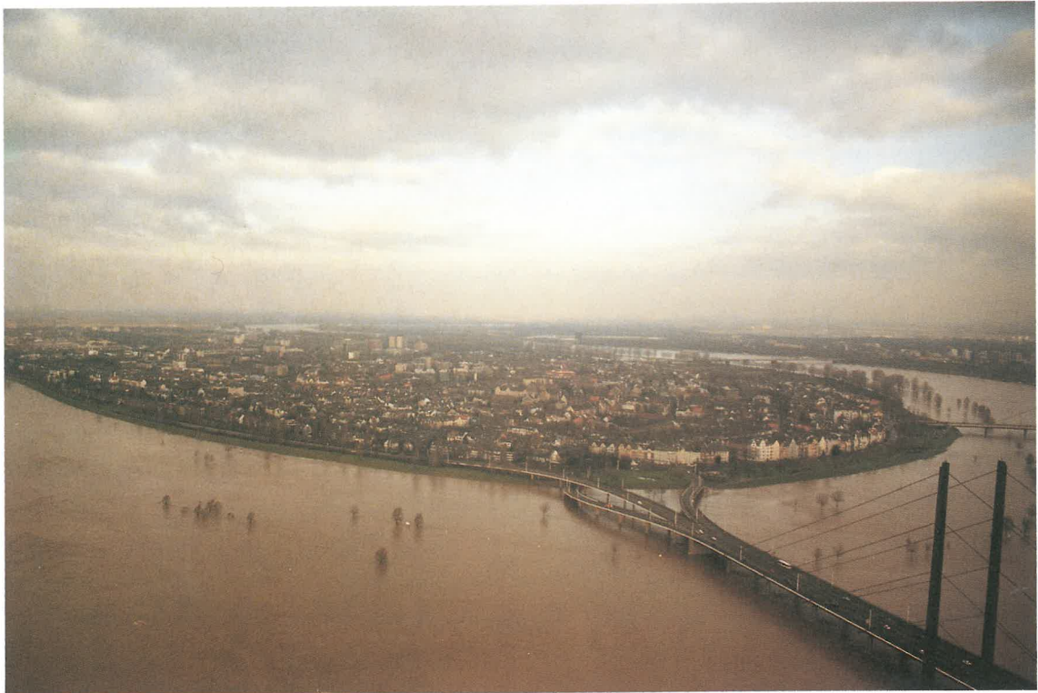
Hochwasser 1995 im Bereich Düsseldorf, Ortsteil Oberkassel